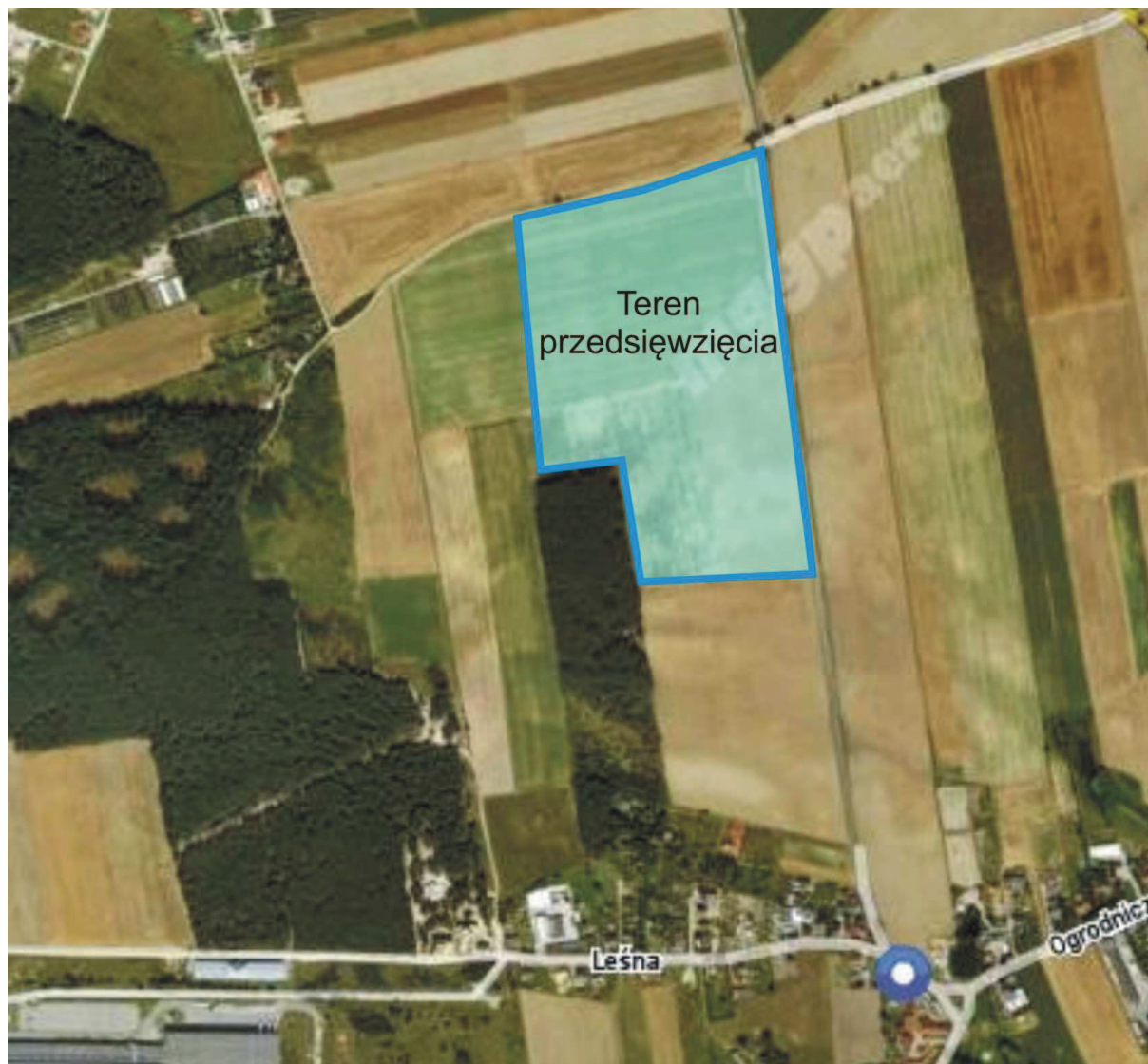
Ryc. Lokalizacja przedsięwzięcia

Najbliższa zabudowa mieszkaniowa znajduje się w odległości ok. 500 m